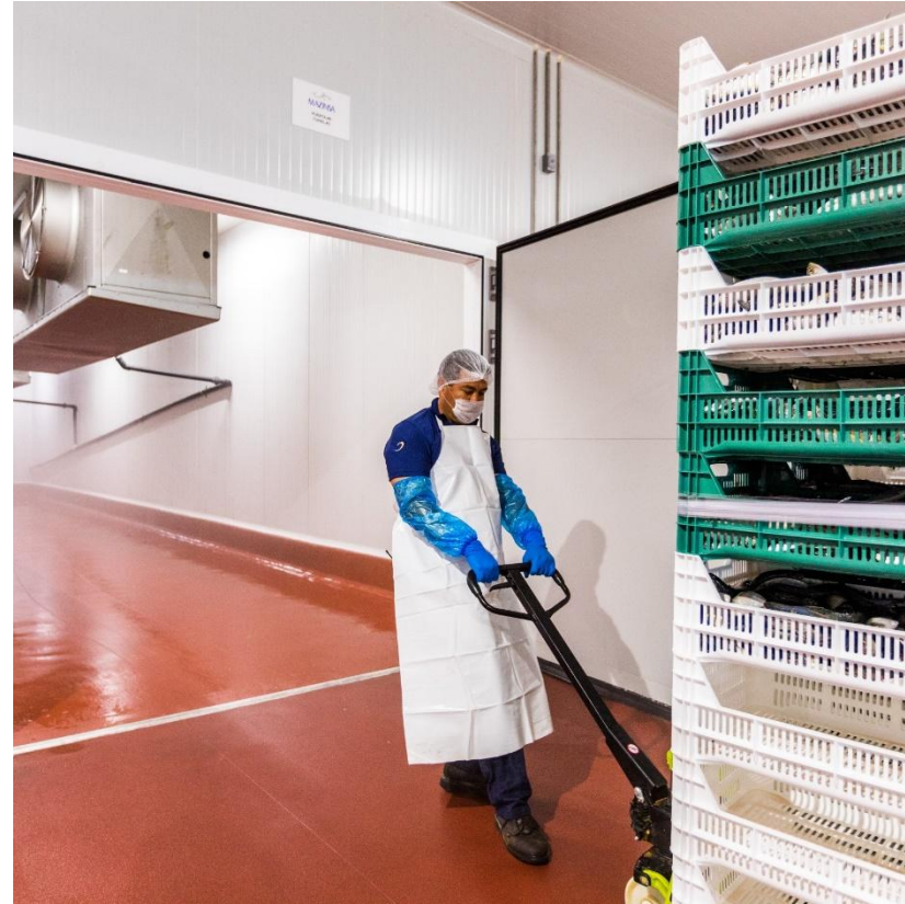
Sardina Congelada, Víscera Congelada,