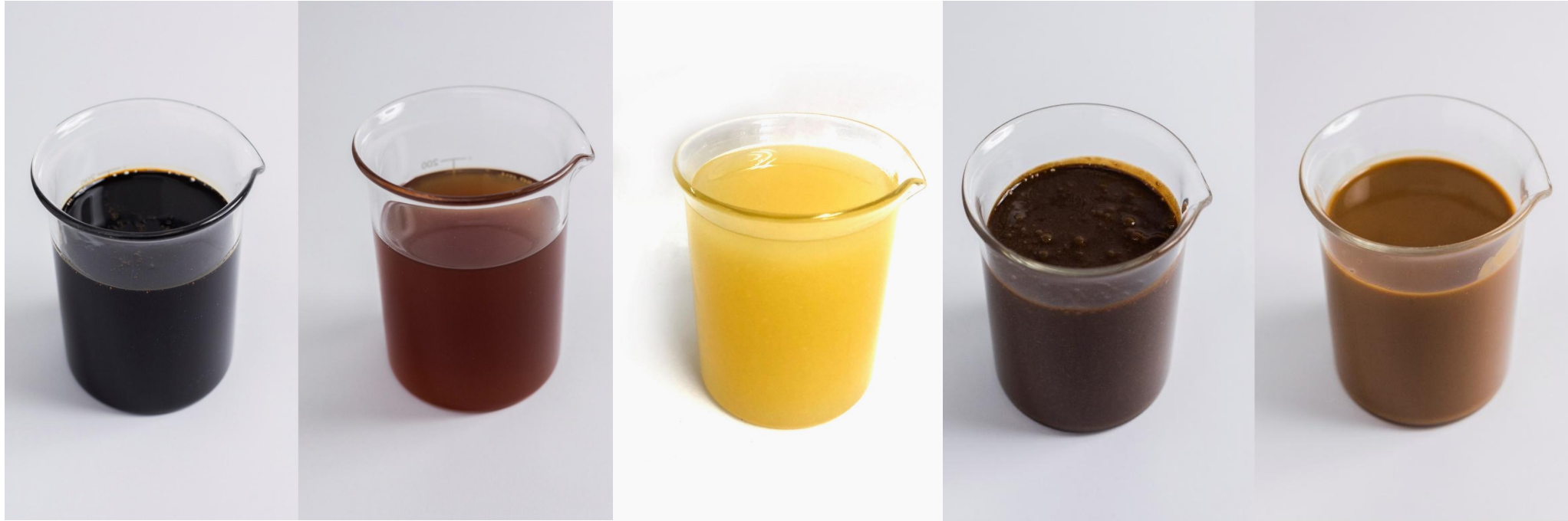
Aceite de Atún, Aceite de Sardina, Aceite de Cabeza, Hidrolizado líquido, Soluble de Pescado