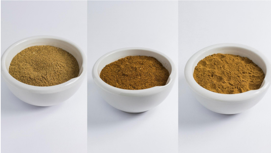
Harina de Sardina, Harina de Atún e Hidrolizado Seco