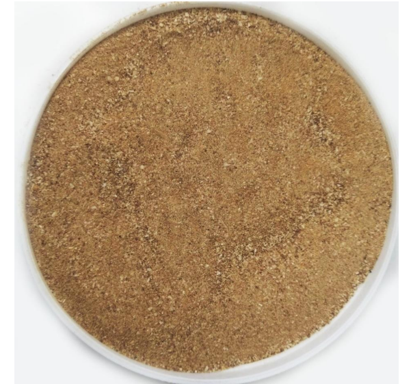
Harina de Camarón, Harina de Hueso