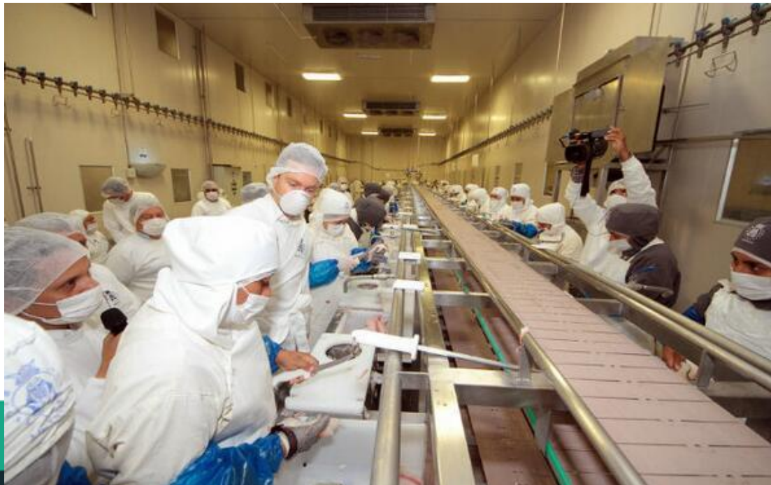
Emiliano Zapata # 55. C.P. 60800. Zapotán, Municipio de Coahuayana, Michoacán, México.

Para el procesamiento de nuestros productos, estos se llevan a cabo en plantas industriales bajo estrictos controles de inocuidad, con certificaciones HACCP, GLOBAL GAP entre otras a través de alianzas que hemos establecido con socios estratégicos.